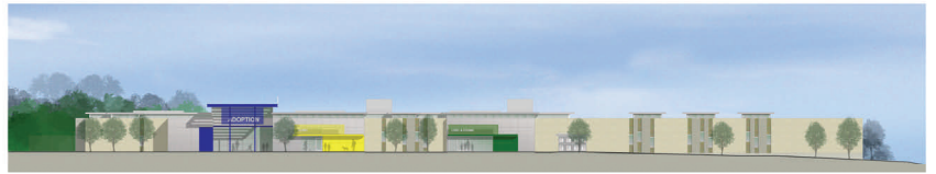
DALLAS ANIMAL SHELTER

The new 52,000 sq. ft. facility is located at 1818 N. Westmoreland Rd at I-30, at the northeast quadrant of the intersection. A day of celebration is planned featuring animal adoptions, and family-friendly activities, including crafts, coloring, face-painting and games. Featured events include a top dog trainer, a cat behaviorist, and an American Red Cross officer with fist-aid advice for pet owners. The day-long event will be open to the public.